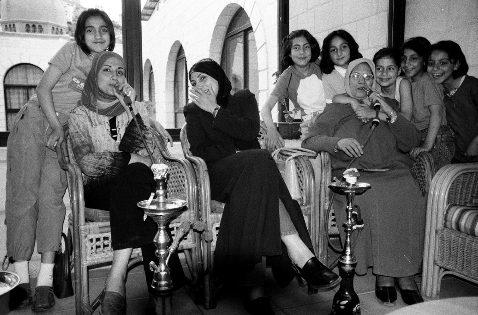
Les femmes d'une famille se retrouvent autour d'un Narguilé dans le seul hôtel et restaurant ouvert dans la vieille ville de Naplouse, Cisjordanie, Mai 2004.