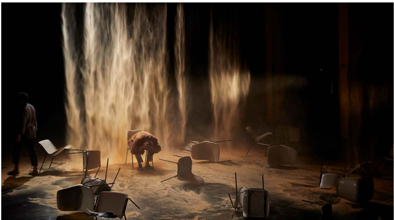
PLACE - Gymnase du Lycée St Joseph, Festival d'Avignon 2019