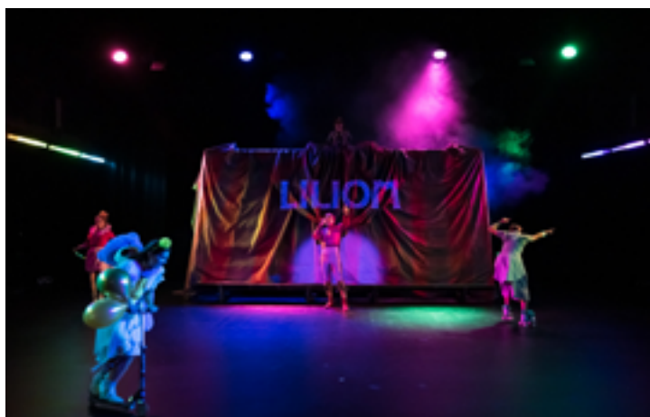
LILION OU LA VIE ET MORT D'UN VAURIEN © Antoine de Saint Phalle

Du mardi 21 au jeudi 23 novembre 2023, Théâtre du Nord, Grande salle, Lille