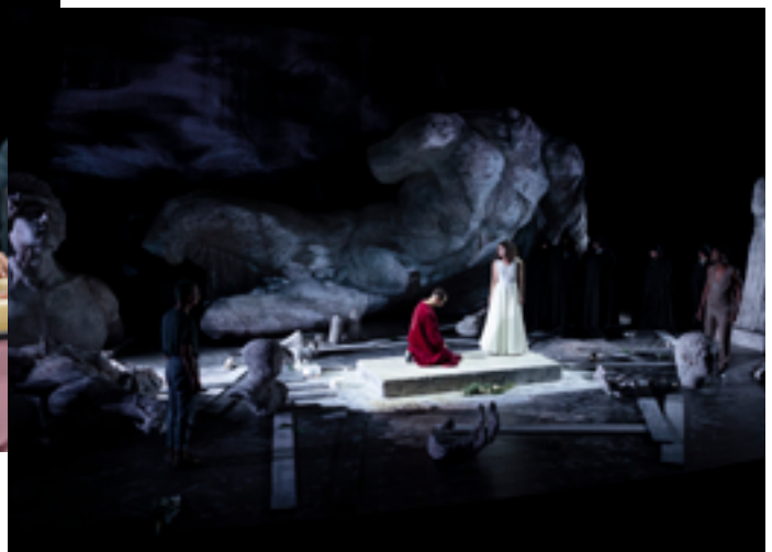
DOM JUAN © Arnaud Bertereau