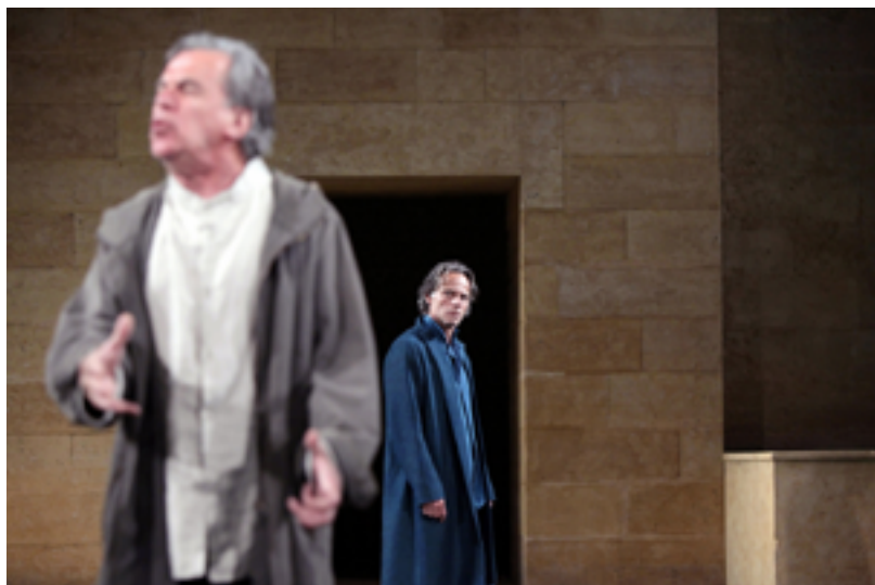
ŒDIPE ROI

*sur demande auprès du service des relations avec les publics