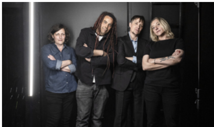
QUATUOR ODDITY